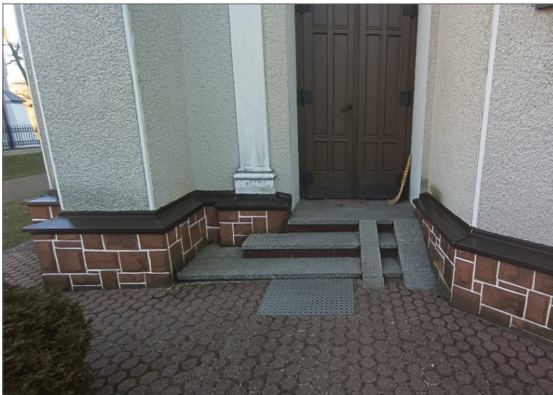
STAN ISTNIEJĄCY SCHODÓW ZEWNĘTRZNYCH