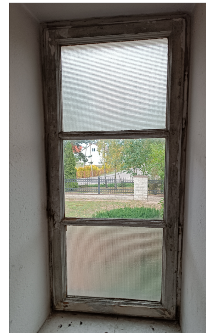
ZDJĘCIE POGLĄDOWE - STAN ISTNIEJĄCY OKNA OD WEWNĄTRZ