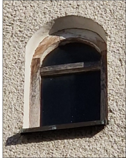
ZDJĘCIE POGLĄDOWE - STAN ISTNIEJĄCY

OKIENKO ZLOKALIZOWANE NA ELEWACJI FRONTOWEJ KOŚCIOŁA- W POZIOMIE DACHU NISKIEGO, ZAKOŃCZONE PÓŁKOLISCIE WYKONANE Z DREWNA MALOWANE BEJCĄ