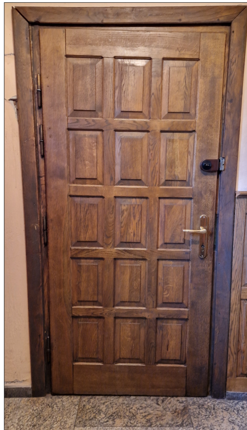
Zdjęcie poglądowe - stan istniejący